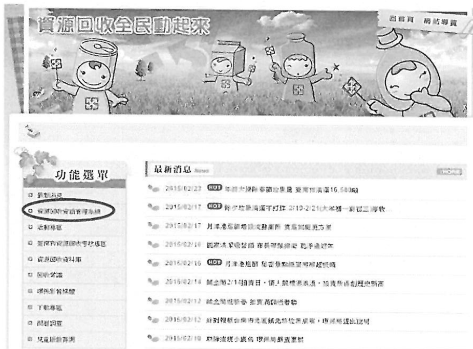
資源回收全民動起來網站首頁截圖