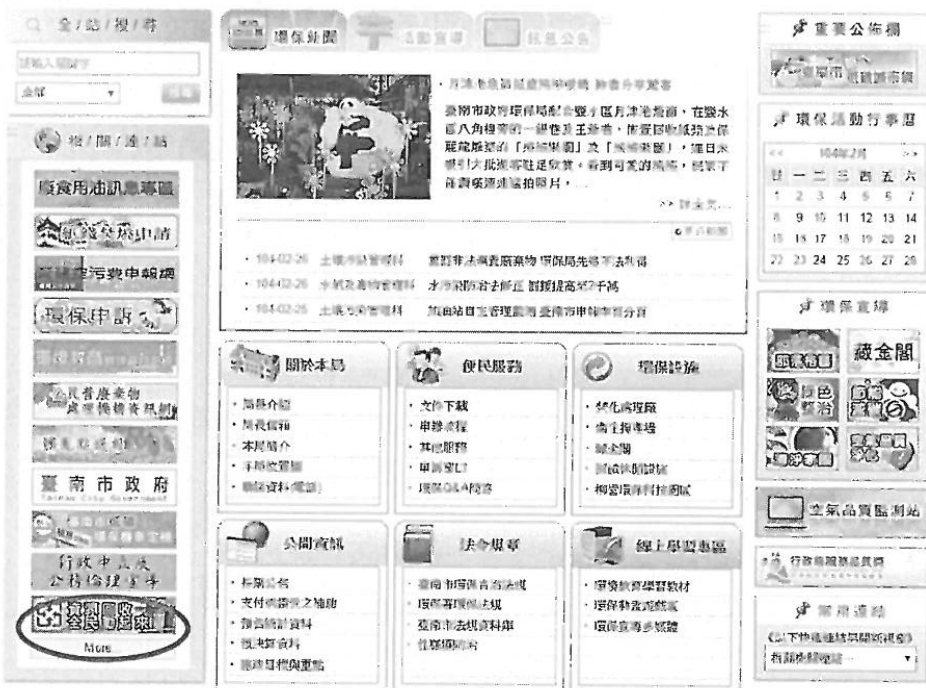
臺南市政府環境保護局網站首頁截圖